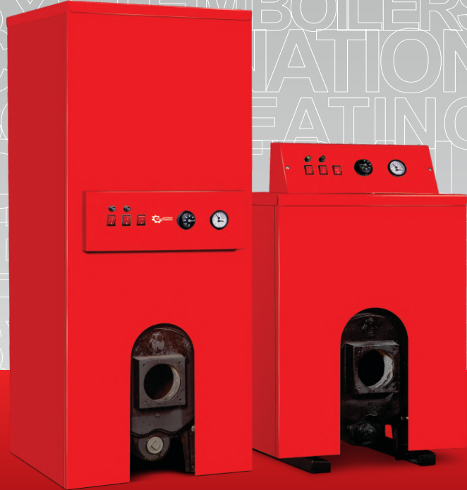
شوفازکار، گرم و ماندگار